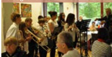
Ensemble d'instruments à vent de l'enseignement secondaire de Roesrath

Merci à tous ceux qui ont contribué à l'organisation et au succès de cet évènement.