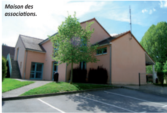
Maison des associations.

Contact : Claire Bigard Feuillard 01 30 54 41 78 - c.feuillard@orange.fr